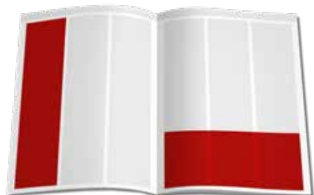
1/2 Seite 190 x 135 mm