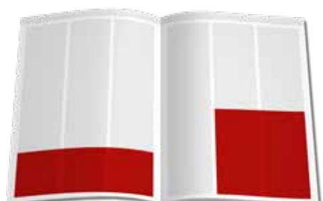
1/4 Seite (quer) 190 x 67 mm