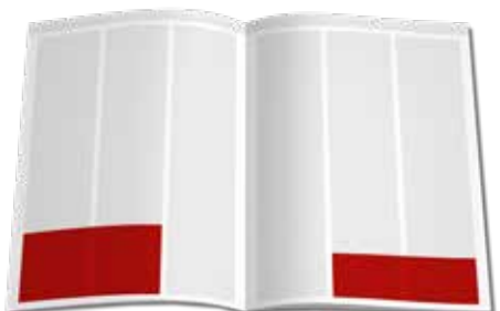
Eckfeld Groß 125 x 135 mm