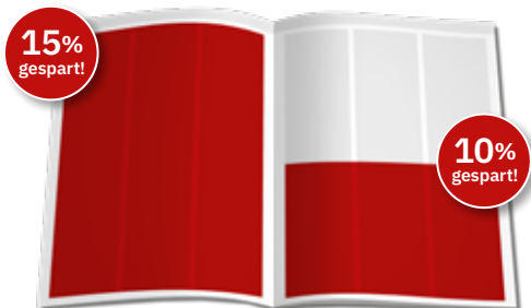
1/1 Seite 190 x 270 mm